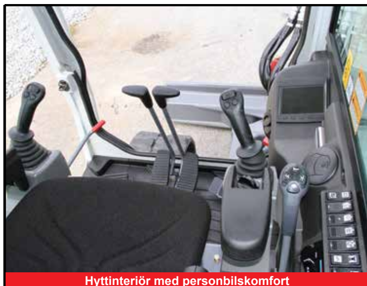
Hyttinteriör med personbilskomfort

*Funktionerna är eventuellt inte tillgängliga i alla länder. Kontakta din Takeuchi-återförsäljare för mer information.