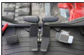
Rymligt golv med fotstöd