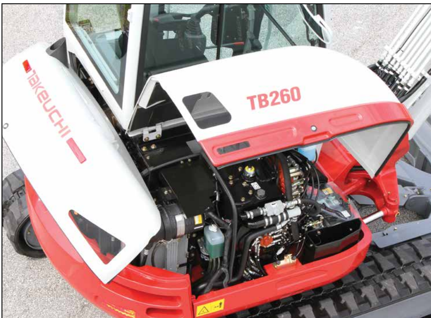
Stora, låsbara servicehuvar ger vandalskydd och enkel åtkomst för service och underhåll

Andra egenskaper är automatisk tomgång, robust kylmodul och en stor, omslutande motvikt som skyddar motorkomponenterna mot skador.